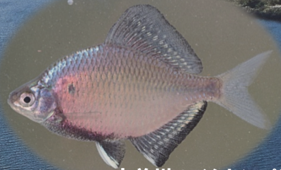
木曽川のイタセンバラ