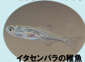
イタセンバラの稚魚

なお、発表内容について、映像の保存や音声の録音といった行為は禁止とさせていただきます。