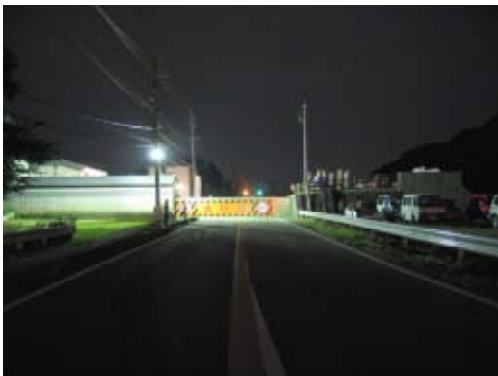
陸閘全景 (鷺沼側より勝山陸閘を望む)