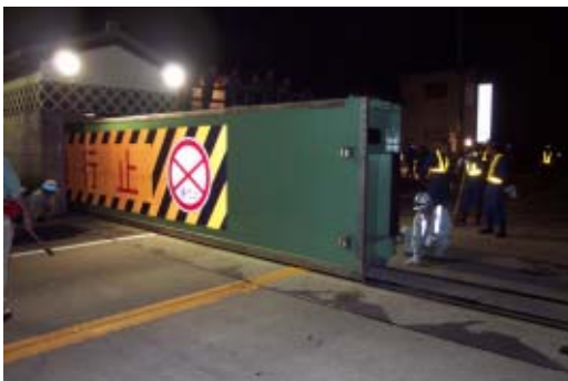
陸閘閉鎖作業状況