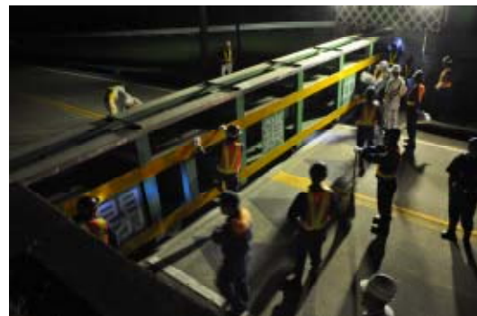
陸閘点検実施状況