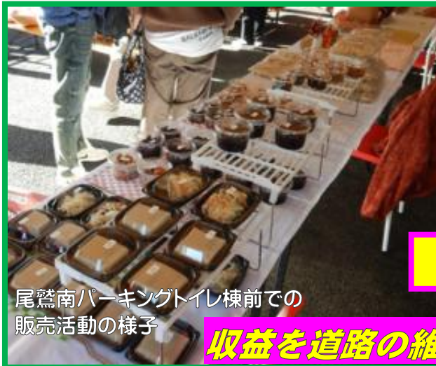
尾鷲南パーキングトイレ棟前での販売活動の様子