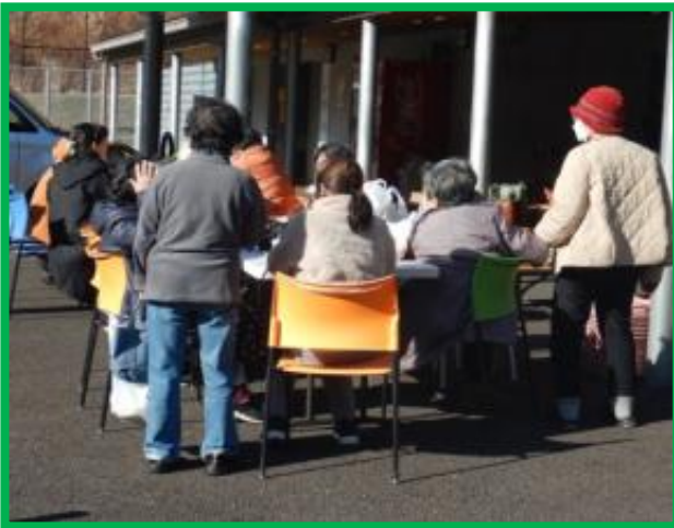
販売活動(じものいち)の様子 (尾鷲市南浦・尾鷲南パーキング) 令和8年2月実施状況