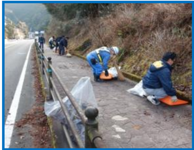
清掃活動の様子 (紀北町便ノ山・熊野古道馬越峠入口付近) 令和8年2月実施状況