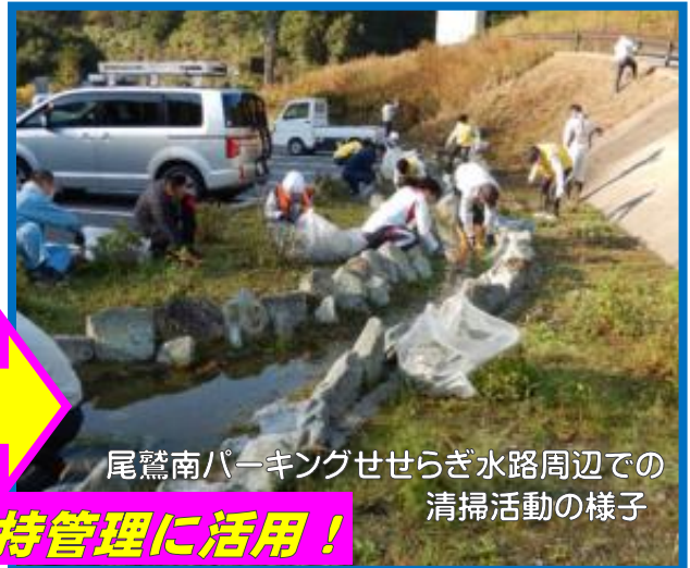
尾鷲南パーキングせせらぎ水路周辺での清掃活動の様子