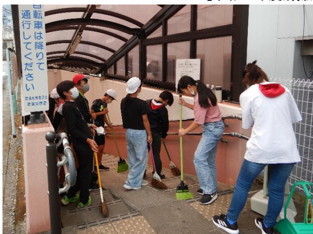
【令和 5 年度清掃活動の様子】

尾鷲市立尾鷲小学校 3 年生の皆さんが、国道 4 2 号の地下横断歩道の美化清掃活動を実施します。