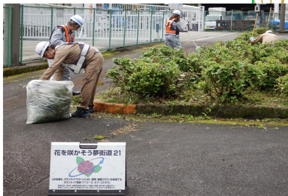
紫陽花周辺の清掃活動の様子 (尾鷲市南浦駐車帯※) 令和5年11月実施状況

※尾鷲南パーキングで活動が行われる以前は、尾鷲市南浦駐車帯で実施されていました。