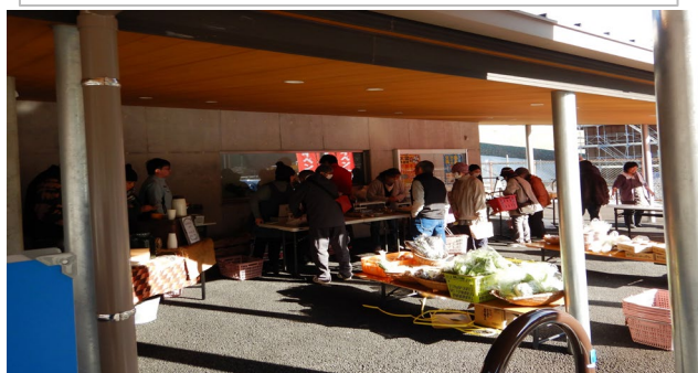
販売活動(じものいち) (尾鷲南パーキング内) 令和6年2月実施状況