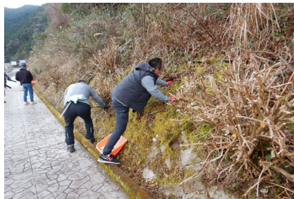
歩道の清掃の様子（紀北町便ノ山地区） 令和6年2月実施状況