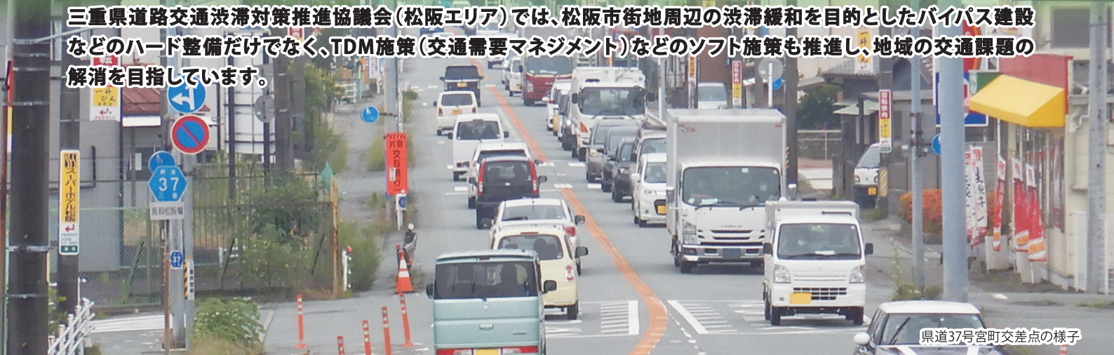
県道37号宮町交差点の様子

三重県道路交通渋滞対策推進協議会(松阪エリア)では、松阪市街地周辺の渋滞緩和を目的としたバイパス建設などのハード整備だけでなく、TDM施策(交通需要マネジメント)などのソフト施策も推進し、地域の交通課題の解消を目指しています。