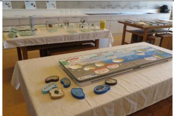
知ろう！ふれあおう！三河湾 i n モリコロパーク 生きものパズル、生きもの標本