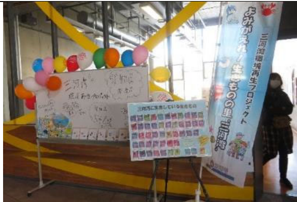
知ろう！ふれあおう！三河湾 i n モリコロパーク ブースの様子