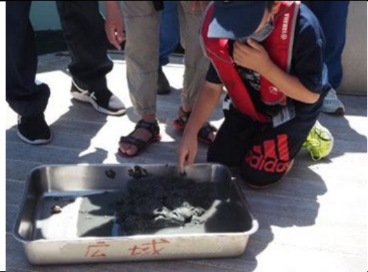
三河湾環境学習会 環境調査（底質調査）