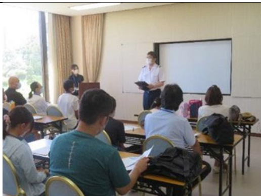
三河湾環境学習会 開会（三谷水産高校 校長挨拶）