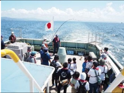
三河湾環境学習会 かつおの一本釣り見学