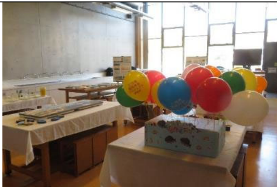
知ろう！ふれあおう！三河湾 i n モリコロパーク PR