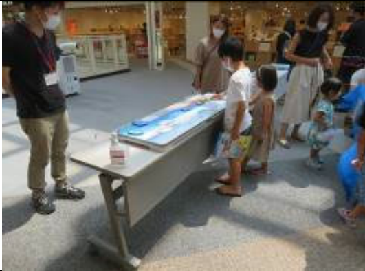
知ろう！ふれあおう！三河湾 i n イオンモール岡崎 生きものパズル