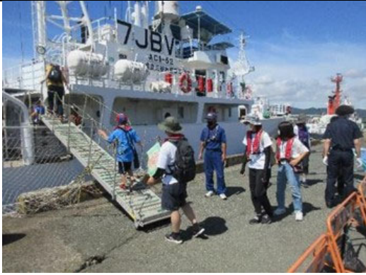
三河湾環境学習会 乗船