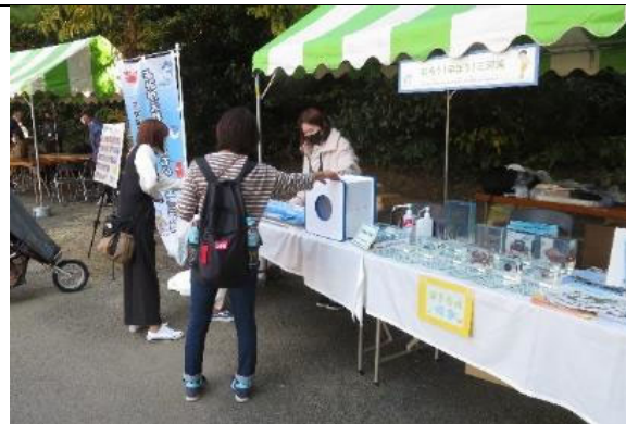
知ろう！ふれあおう！三河湾 i n のんほいパーク 生きものパズル