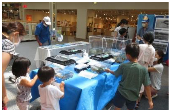
知ろう！ふれあおう！三河湾 i n イオンモール岡崎 生きもの展示