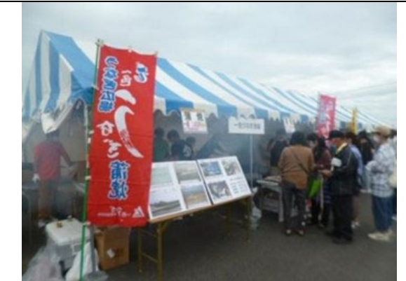
三河湾大感謝祭 出展ブース