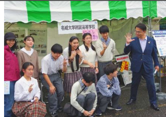
三河湾大感謝祭 出展ブース