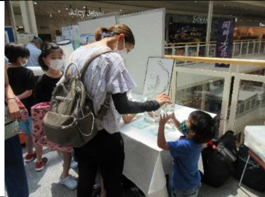
知ろう！ふれあおう！三河湾 i n イオンモール岡崎 生きもの標本