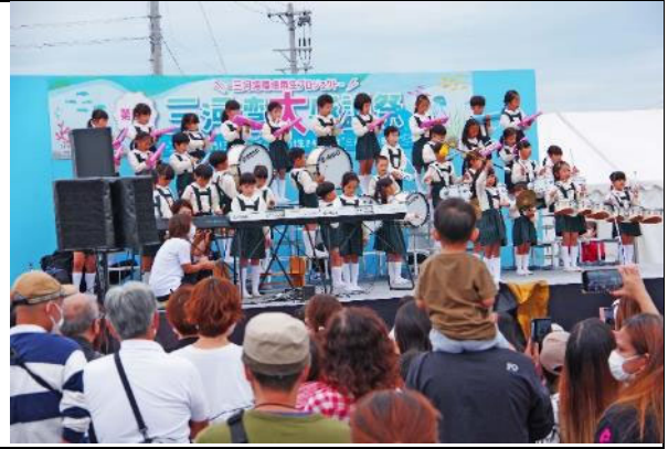
三河湾大感謝祭 マーチングバンド