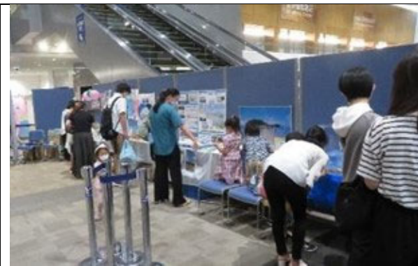
知ろう！ふれあおう！三河湾 i n エアポートウォーク名古屋 ブースの様子