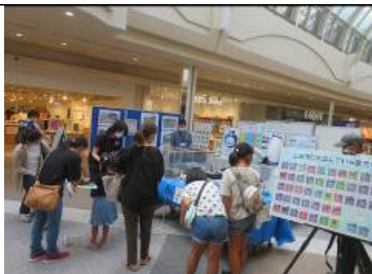
知ろう！ふれあおう！三河湾 i n イオンモール岡崎 ブースの様子