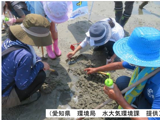
(愛知県 環境局 水大気環境課 提供)