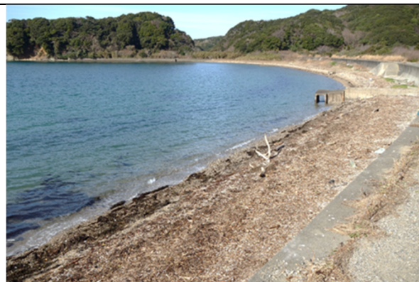
鳥羽市答志島奈佐の浜海岸 清掃後(R4.01.17)