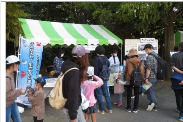
知ろう！ふれあおう！三河湾 i n のんほいパーク ブースの様子