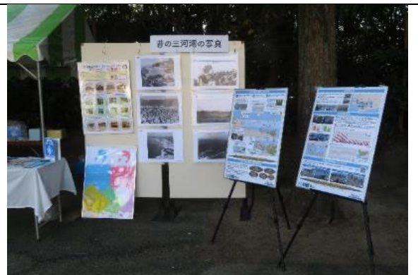
知ろう！ふれあおう！三河湾 i n のんほいパーク 三河湾の写真展示