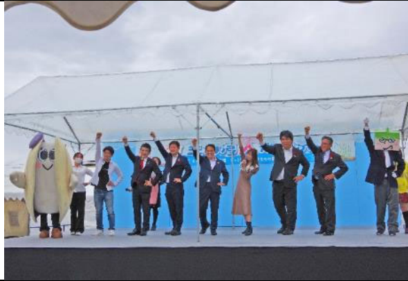
三河湾大感謝祭 セレモニー