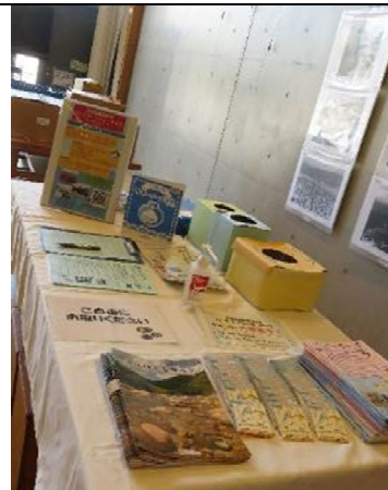
知ろう！ふれあおう！三河湾 i n モリコロパーク 三河湾の写真展示等