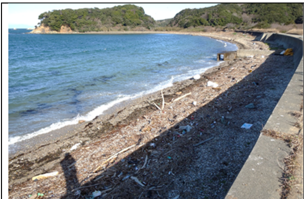
鳥羽市答志島奈佐の浜海岸 清掃前(R4.01.17)