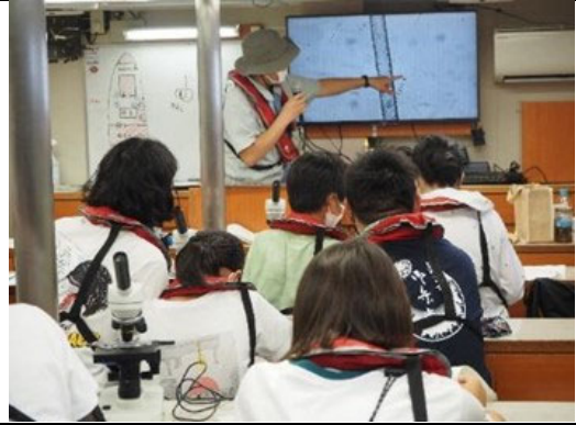
三河湾環境学習会 環境調査（プランクトン観察）