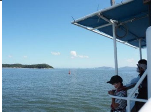
三河湾環境学習会 出航・船内見学