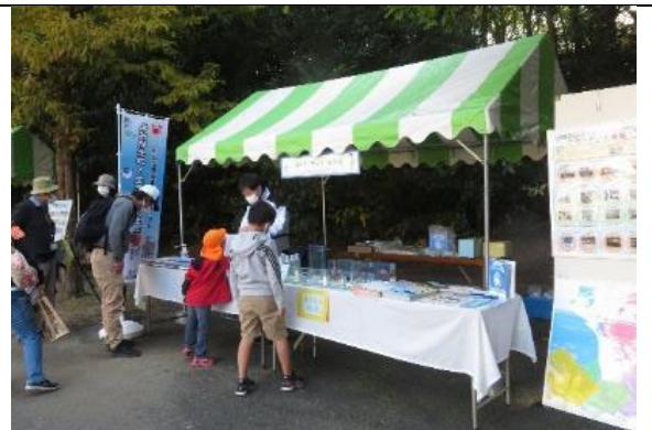
知ろう！ふれあおう！三河湾 i n のんほいパーク 生きもの標本