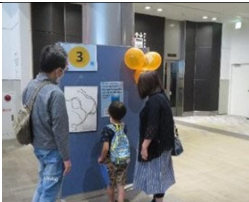
知ろう！ふれあおう！三河湾 i n エアポートウォーク名古屋 クイズラリー