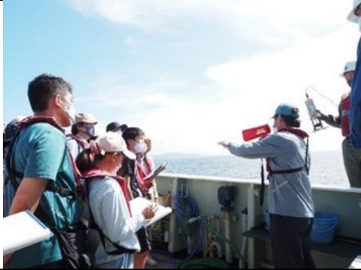
三河湾環境学習会 環境調査（水質調査）