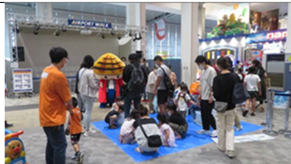
知ろう！ふれあおう！三河湾 i n エアポートウォーク名古屋 PR