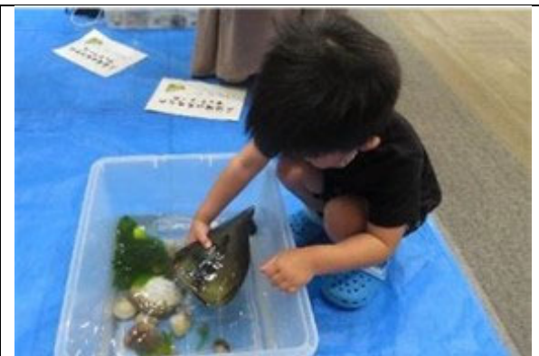
知ろう！ふれあおう！三河湾 i n エアポートウォーク名古屋 生きものタッチプール