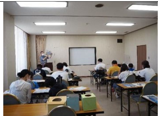
三河湾環境学習会 セミナー