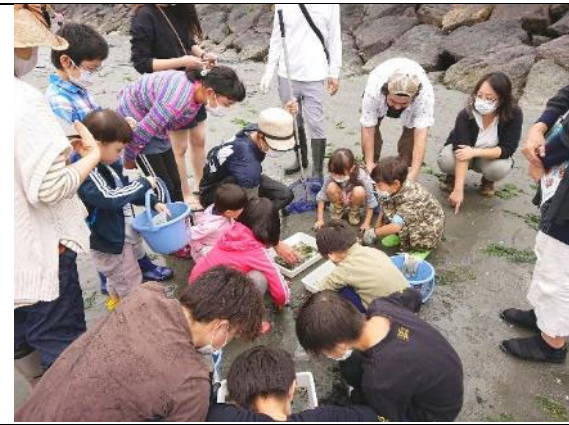
三河湾大感謝祭 生きもの観察会