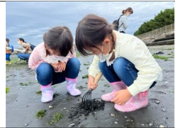
三河湾大感謝祭 生きもの観察会