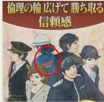
制服の一例にテックフォースの制服が入った政府ポスター