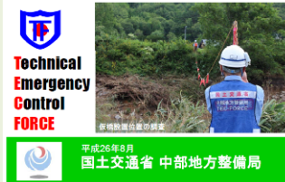
テックフォース派遣