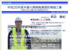
若手技術者の声 (中部地方整備局WEBサイト)