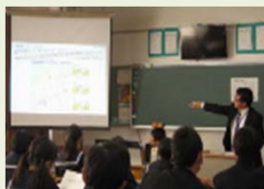
学校関係へ出前講座