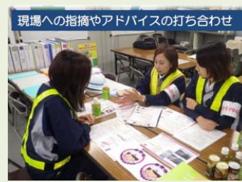
土木女子パトロール