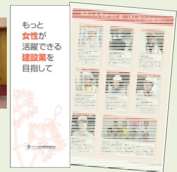
けんせつのかいでの働く女性のパンフレット