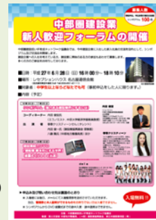
中部建設業 新人歓迎フォーラム