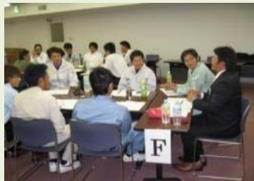
グループディスカッション (建設若者塾)