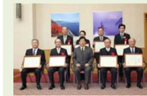
ふじの国子育て応援リーディング カンパニー表彰式