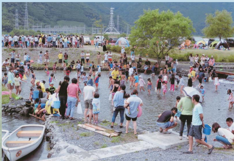
うしづま水辺の楽校の利用状況