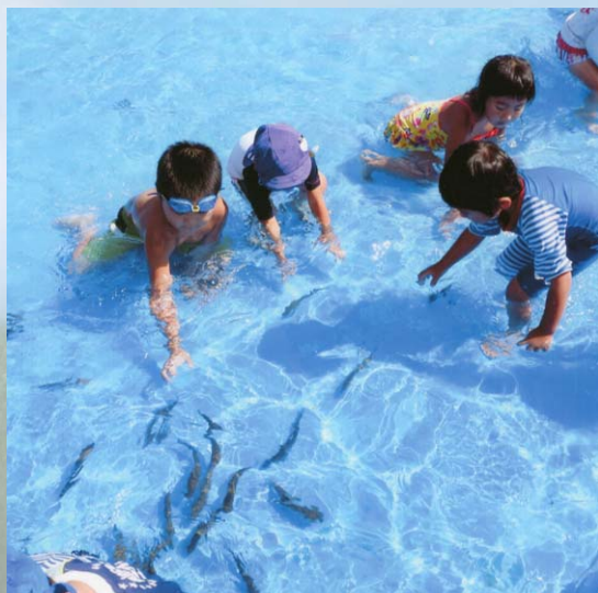
アマゴのつかみ取りを通して食物連鎖の仕組みを子供達に教えている