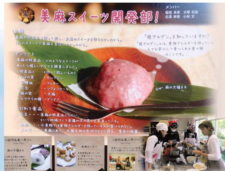
地域と学ぶ総合学習 美麻市民(いちみん)科(コミュニティスクール)