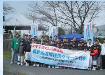
世界農業遺産「清流長良川の鮎」として認定されるまでの川づくりから遺産保護と清流長良川を後世に引き継ぐ「川づくり」を目指す。