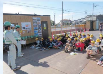
エコミーティング ～地域から頼られる建設会社を目指して～