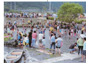
子どもたちのいっぱいの笑顔、 オクシズの魅力アップをめざすオヤジたちの心意気