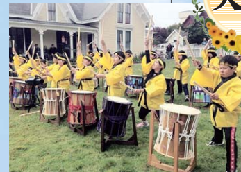
「地域のデザイン」を、住民自治で!