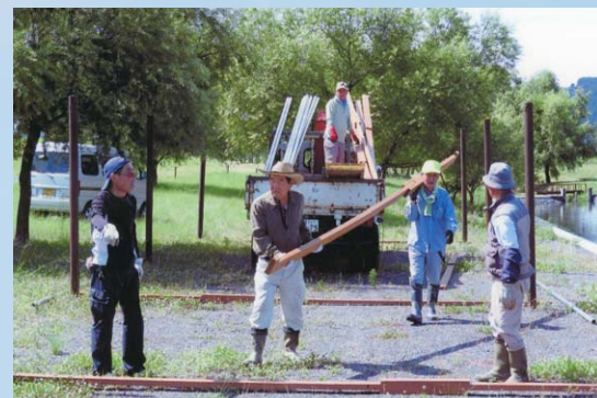
炎天下の河川敷に日陰場を作り来校者の安全を計っている