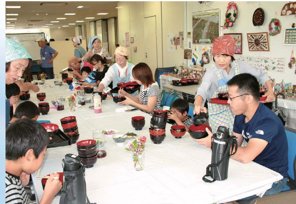
江南わんこソーメン大会