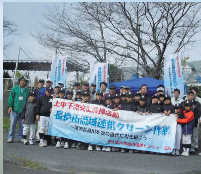
長良川流域連携クリーン作戦活動(関市地点)