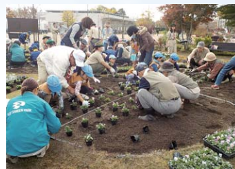
官民協働で作って行く フラワーパーク江南