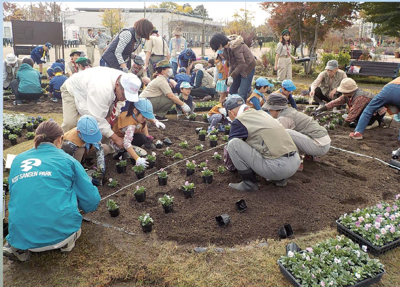
市民花壇植栽(ボーイスカウトと共に)