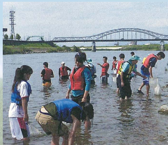
木曾三川水生生物調査(長良川・忠節橋地点)