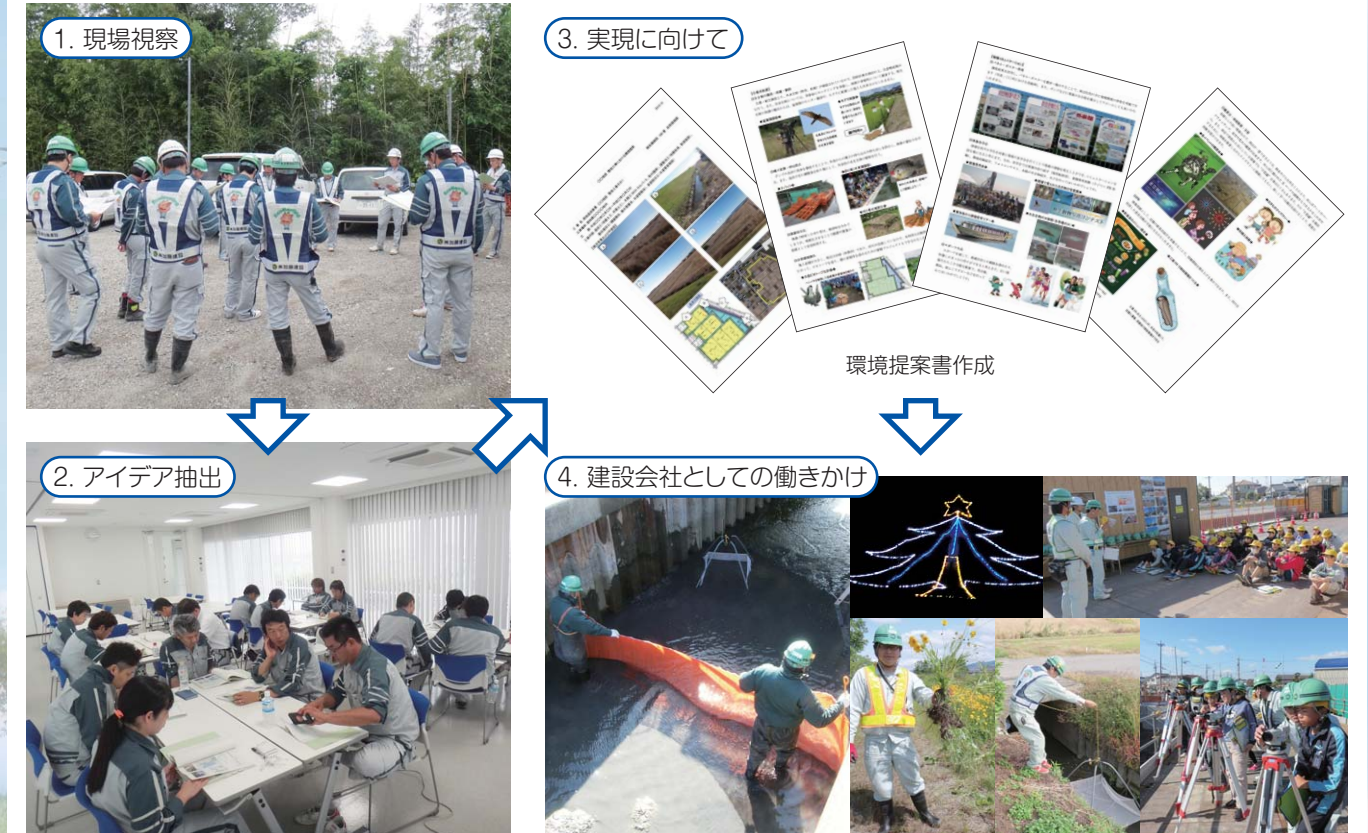
エコミーティングの流れ