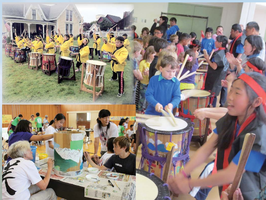
手作りの和太鼓で国際交流(メンドシーノ交流事業)