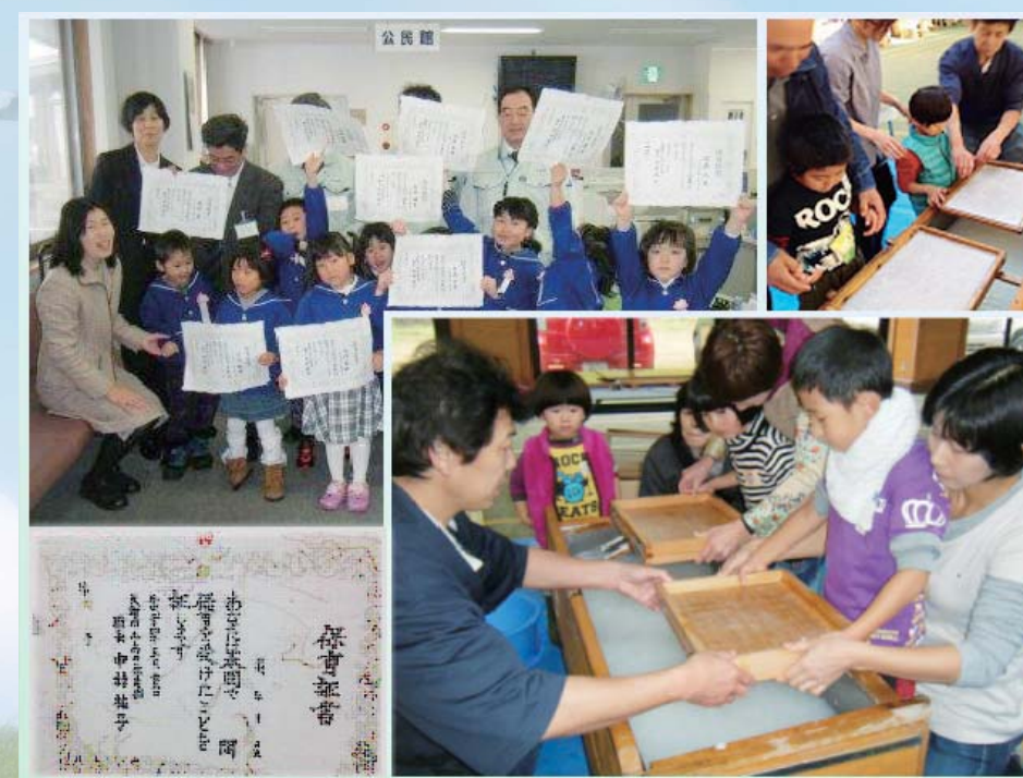
手すきの麻和紙で卒園証書づくり(麻文化伝承活動)