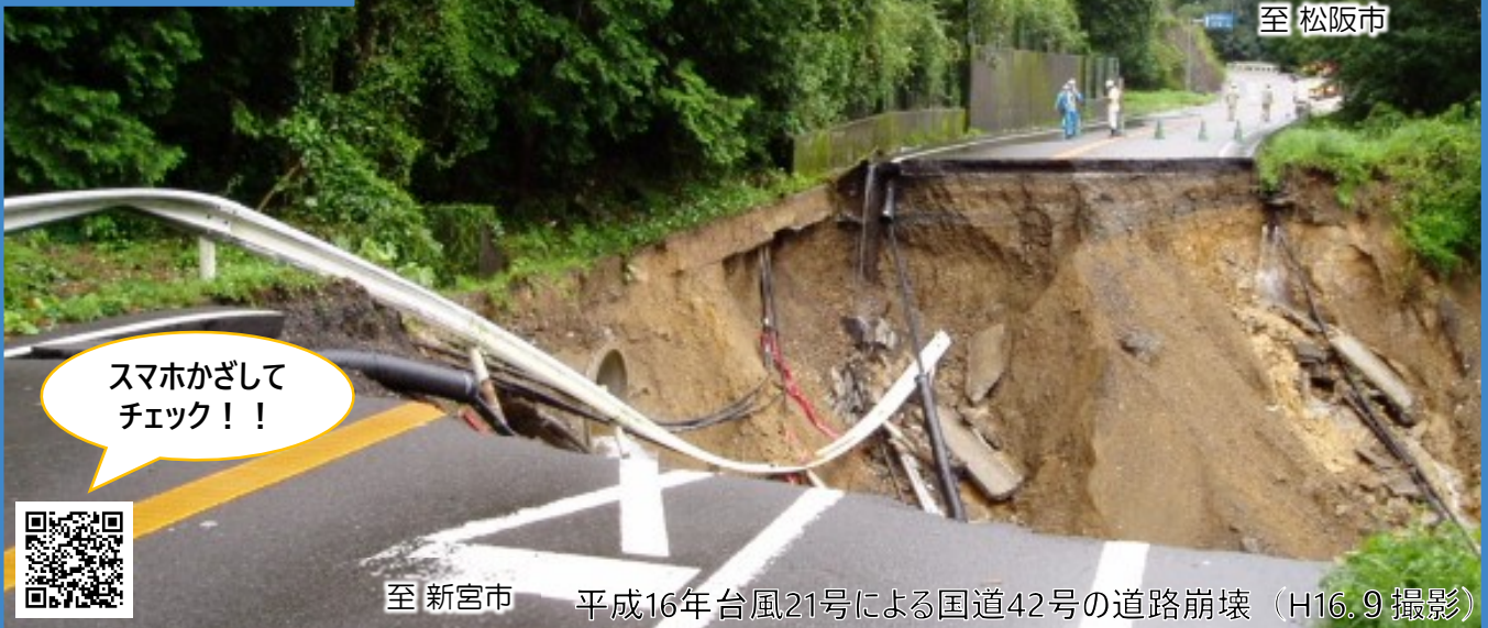
至 新宮市 平成16年台風21号による国道42号の道路崩壊 (H16.9撮影)