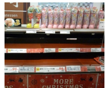
国道42号の被災直後の状況(H25.10) 通行止め時の商品陳列状況(H30.9)