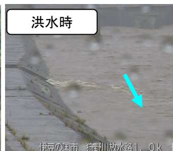
伊豆の国市 狩野川放水路1. Ok 県