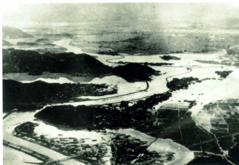
昭和33年9月狩野川台風 田方平野の浸水