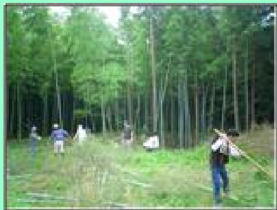
里山の復元 活動状況