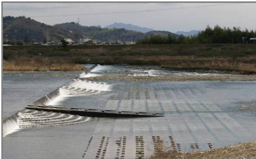
木曾川水系・根尾川第八床固(9.0km付近)の魚道改善の事例