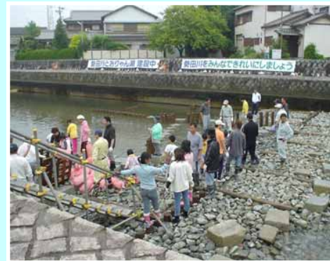
(市民団体により整備された落差工 勢田川とおりゃん瀬)