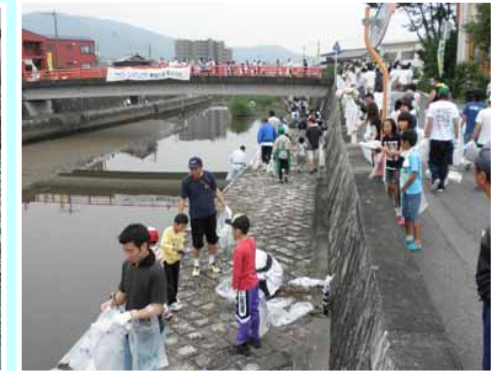
(地域住民による清掃活動 勢田川七夕大掃除)