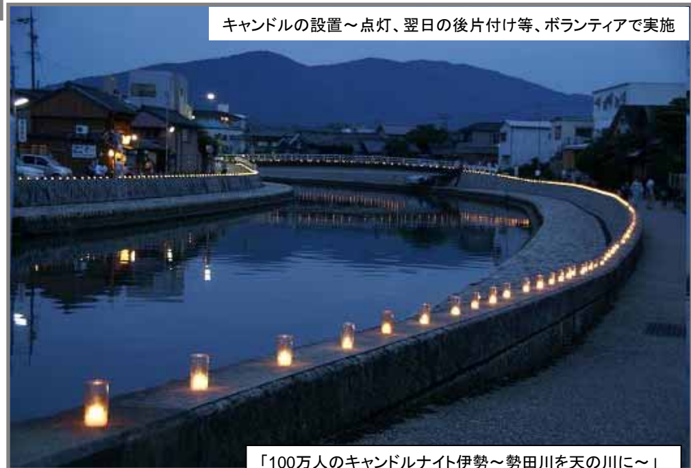
キャンドルの設置～点灯、翌日の後片付け等、ボランティアで実施