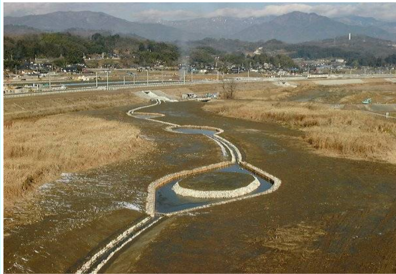
(河川管理者による基盤整備)