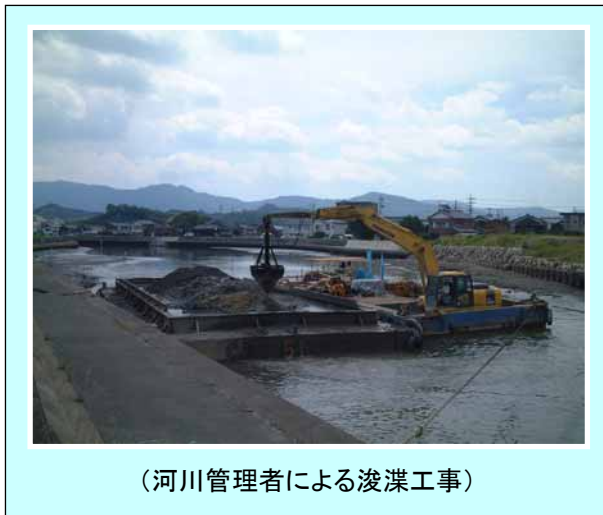
(河川管理者による浚渫工事)