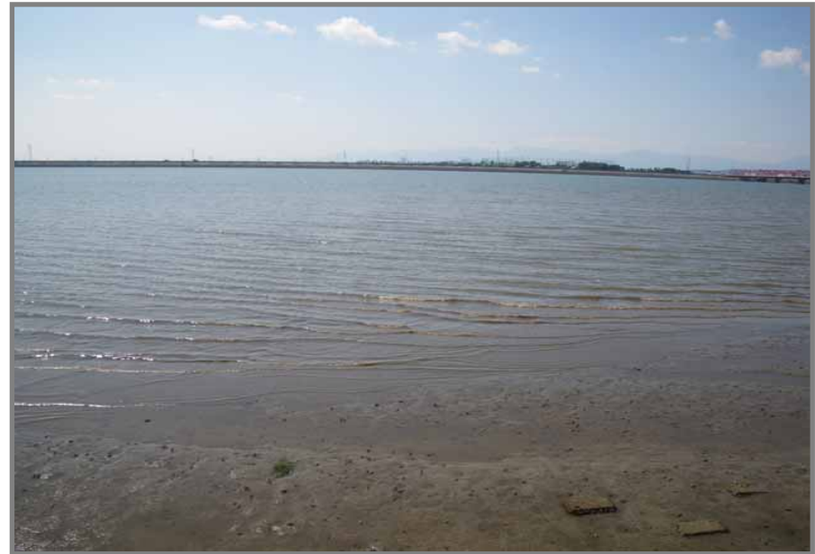
木曾川左岸3.0km付近の干潟再生の事例