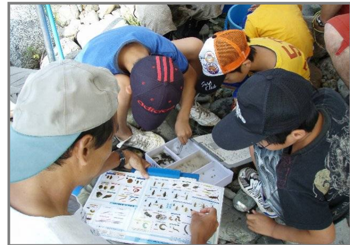
天竜川水系・飯田市川路地区水辺の楽校の事例