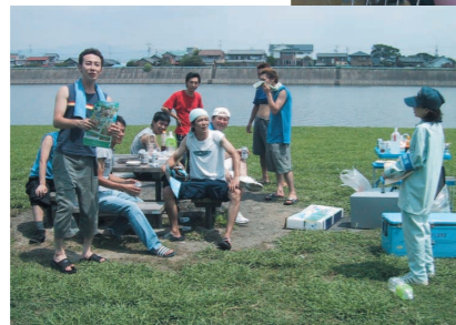
チラシ配布状況（北島公園）