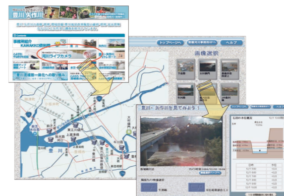
豊橋河川事務所ホームページ 河川のCCTV画像を平成16年4月からホームページで一般の方々へ提供しています。