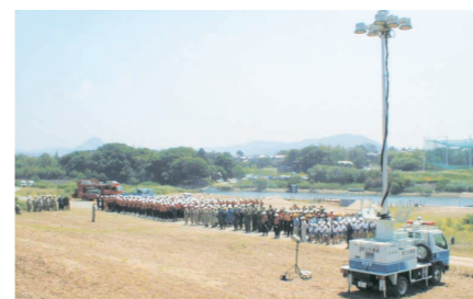
洪水対応訓練実施状況（豊橋市）

また、流域の市町村では出水期前に洪水対応訓練を毎年実施し、防災意識の高揚を図っています。