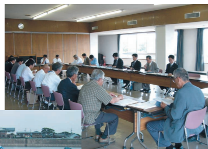
水難事故防止連絡会

安全な河川敷利用を目指して、豊川水系水難事故防止連絡会を設立（H17年6月）しています。この連絡会は、豊川水系の河川管理者、地方自治体、警察、消防、漁協で構成されています。河川利用状況図を共同で作成して、河川利用情報の共有化に努めています。また、適正な河川利用を呼び掛けるチラシを共同で配布しています。