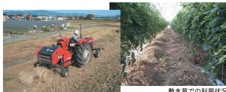
刈草をロール状に梱包

このような取り組みを通じて将来的には、地域住民との河川の協働管理を目指します。なお、樹木伐採等で発生する竹も利用が図られるよう検討しています。