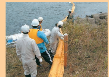
オイルフェンス設置訓練

平成14年7月に、豊川と矢作川の水質汚濁対策連絡協議会を統合し、両水系が情報連絡を密にし、力を合わせて、川と三河湾をきれいにしていきます。