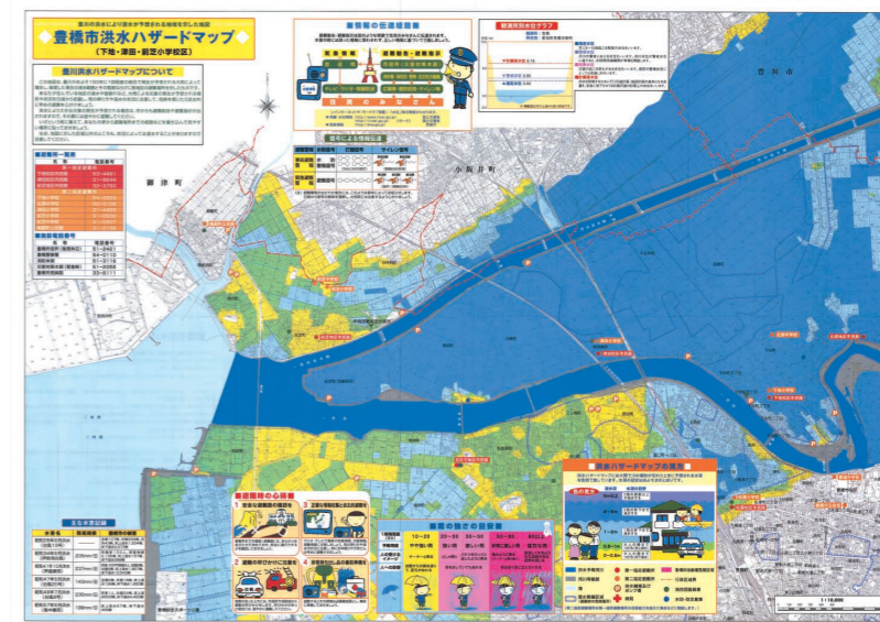
豊橋市の洪水ハザードマップ