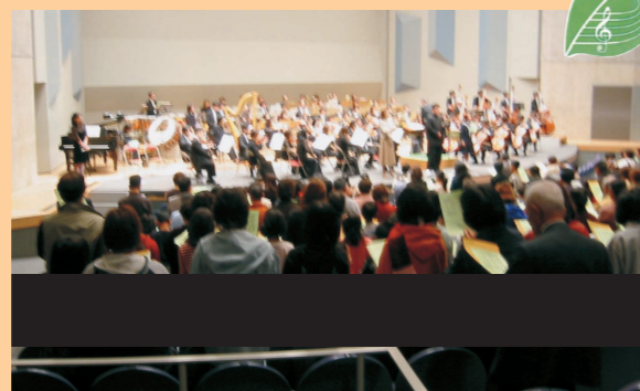
川と緑の交流コンサート

上流域の森林の水源かん養機能や土砂流出の防備機能などの保全が図られるよう、関係機関との連絡・調整を図り、森林の適正な管理がなされるよう努力します。