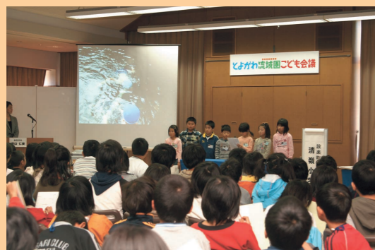
とよがわ流域圏子ども会議

豊川流域圏の課題にかかわる情報発信を様々なイベントを通じて行なっています。これらの活動により、住民の方々とともに、魅力的な流域圏の形成の一助となるよう努めてまいります。