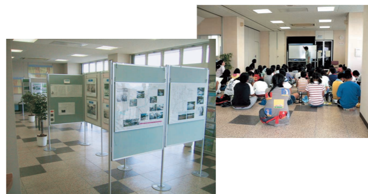
KAWAKKO資料館 平成10年7月の開館から平成18年3月末時点で来場者数約3万6,000人

「河川らしさ」を活かした河川整備を進めるため、ホームページや豊川KAWAKKO資料館等を活用して、豊川に関する情報提供を行い、地域とのコミュニケーションを深めます。