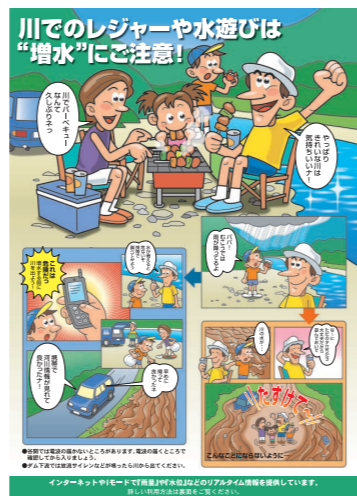
適正な河川利用を呼び掛けるチラシ