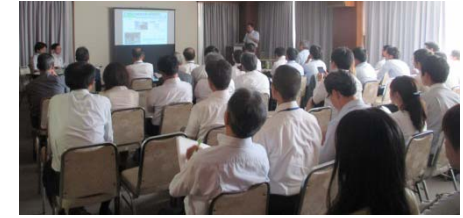
竹の間 (生産性向上、新技術活用)