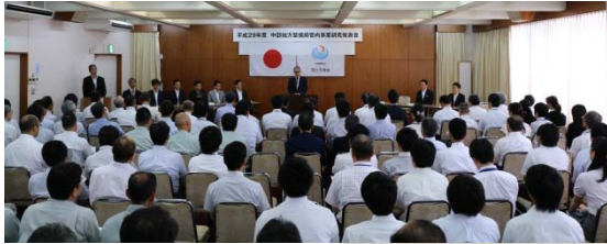
松の間 (中部地整の若手交流会)