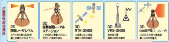
☆3D マシンコントロールシステムブルドーザ