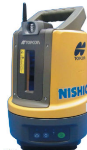
☆杭北 LN-100 測量作業