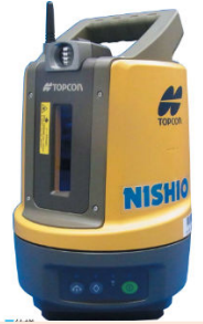
☆杭北 LN-100 測量作業