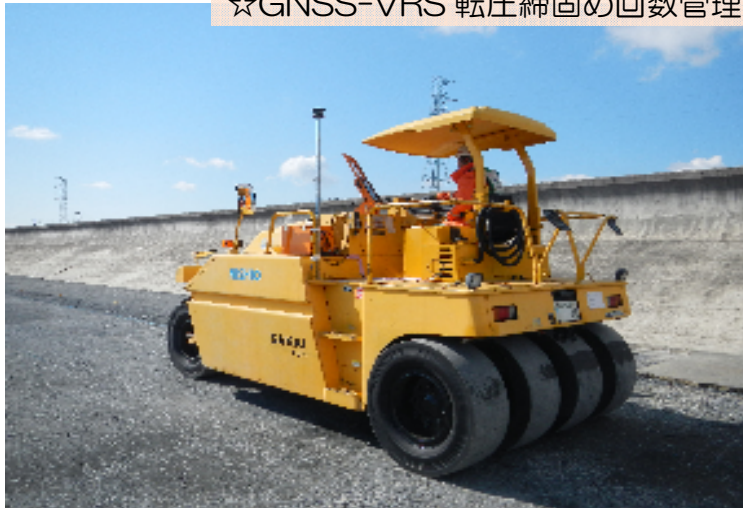
☆GNSS-VRS 転圧締固め回数管理システム