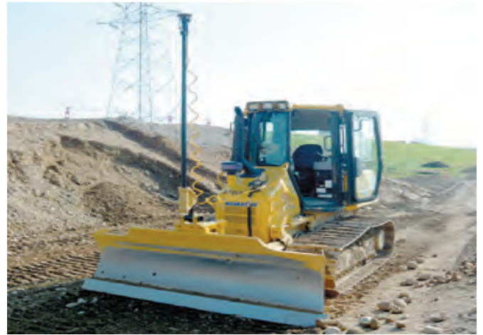
☆3D マシコントロールシステムブルドーザー