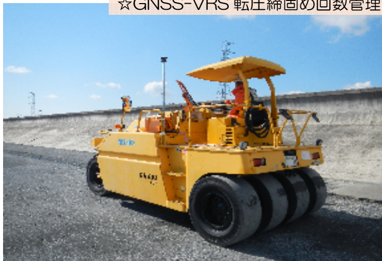
☆GNSS-VRS 転圧締固め回数管理システム