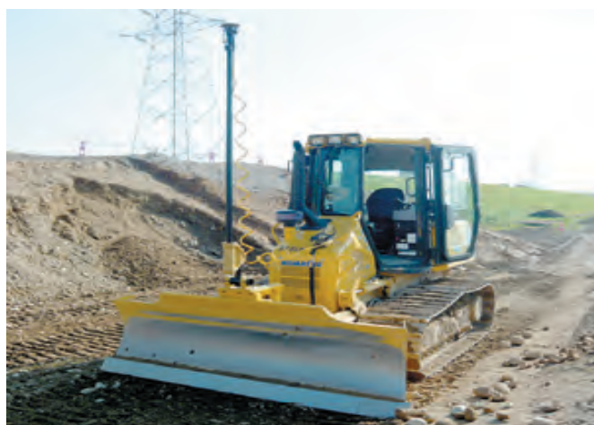
☆3D マシコントロールシステムブルドーザー