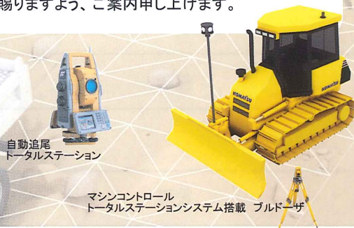
自動追尾トータルステーション