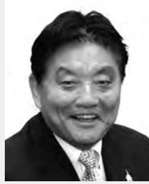
名古屋市長 かわむら 河村 たかし 氏

1948年名古屋市生まれ。一橋大学商学部を卒業後、1993年より衆議院議員を5期務め、2009年名古屋市市長に就任し現在に至る。減税日本代表を兼務し、著書に名古屋発どえりゃあ革命!(ベスト新書、2011年)、名古屋から革命を起す!(家族で読める family book series—たちまちわかる最新時事解説)(2009年)など。