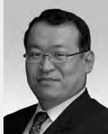
飯田市長 まきの みつお 牧野 光朗 氏

1948年名古屋市生まれ。一橋大学商学部を卒業後、1993年より衆議院議員を5期務め、2009年名古屋市市長に就任し現在に至る。減税日本代表を兼務し、著書に名古屋発どえりゃあ革命!(ベスト新書、2011年)、名古屋から革命を起す!(家族で読める family book series—たちまちわかる最新時事解説)(2009年)など。