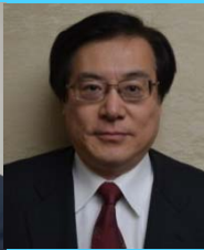
中部地方 整備局長