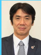
和歌山県 串本町長