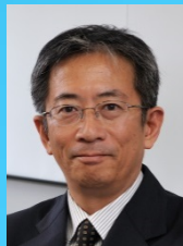
福和名古屋大学 教授減災連携 研究センター長