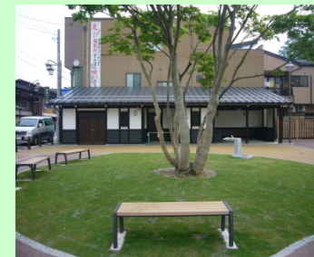
岐阜県 飛騨市 (神岡地区)