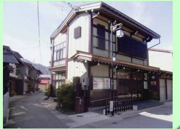
岐阜県 飛騨市 (古川地区)