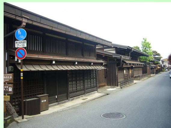
岐阜県 高山市 (高山市美しい景観と潤いのあるまちづくり条例)