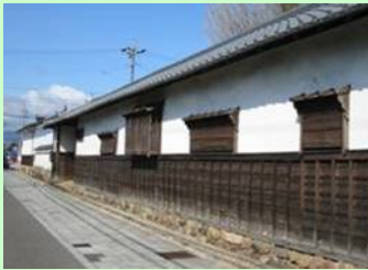
※10年以上の一般公開を行うもの 三重県 亀山市