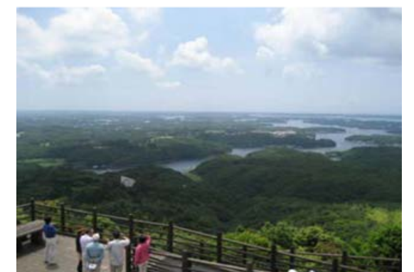
創造の森横山（志摩市）