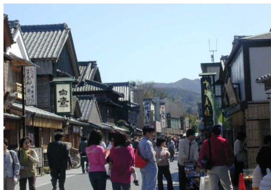
内宮おはらい町地区（伊勢市）

市町村は、都市計画に 景観地区 を定めることにより、建築物の形態意匠や高さ、壁面位置等の規制や、工作物の設置や土地の形質変更等の規制を行うことができます。