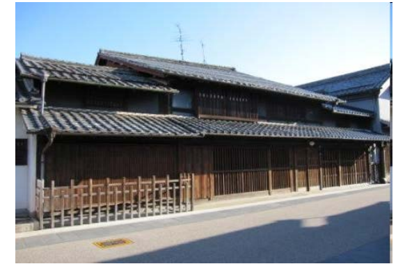
桑原家住宅主屋（岐阜市）