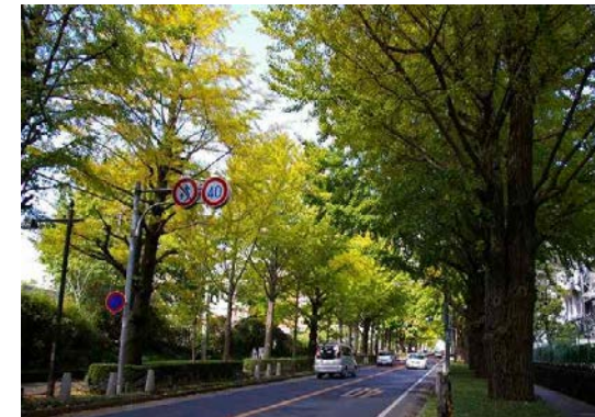
文教町のイチヨウ並木（三島市）

景観計画区域内の良好な景観の形成に重要な樹木を 景観重要樹木 として指定することにより、現状変更の規制等（行為者に対する許可・原状回復命令等）を行うことができます。