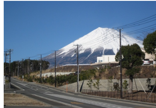
富士山フロント工業団地（富士市）