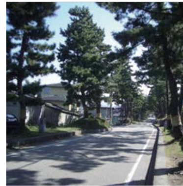
藤川の松並木（岡崎市）