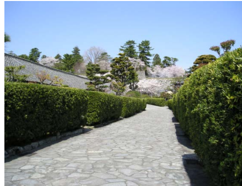
御城番屋敷（松阪市）