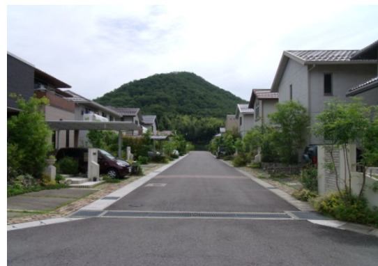
グリーンランド柄山景観地区（各務原市）