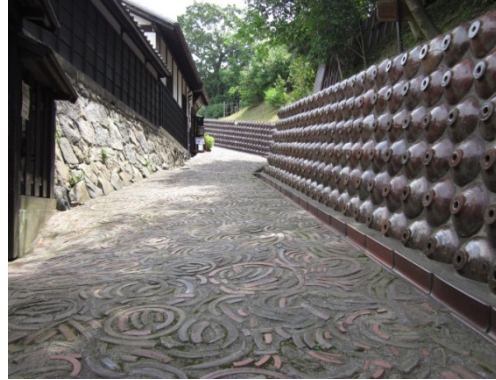
やきもの散歩道（常滑市）

（※）景観行政団体 …… 都道府県、政令市、中核市及び都道府県との協議を経たその他の市町村