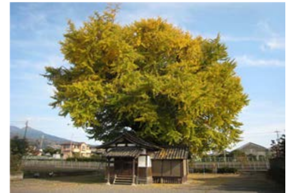
富士岡地藏堂のイチヨウ（富士市）