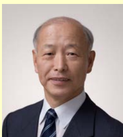
郡上市長 日置 敏明 氏