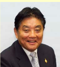
名古屋市長 河村 たかし 氏