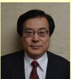
中部地方整備局長 八鍬 隆