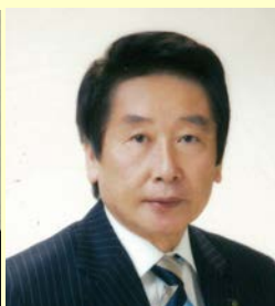
岐阜市長 細江 茂光 氏