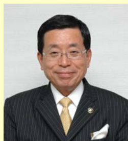
高山市長 國島 芳明 氏