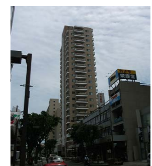
豊橋広小路三丁目B-2地区優良建築物等整備事業（共同化タイプ）（豊橋市）