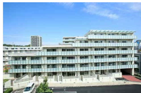
豊田小坂本町三丁目地区優良建築物整備事業（中心市街地共同住宅供給タイプ）（豊田市）

認定を受けた中心市街地活性化基本計画の区域等において、本事業による支援を受けることができます。