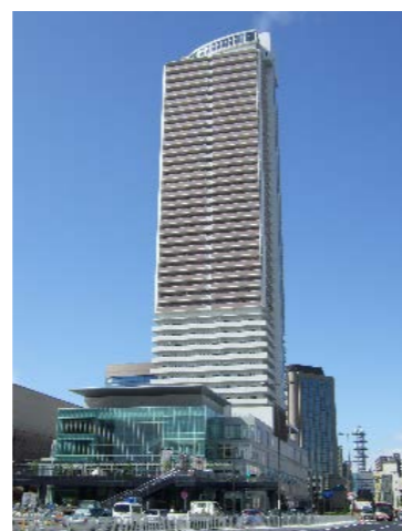
問屋町西部南街区第一種市街地再開発事業（岐阜市）