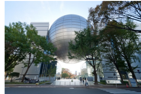
名古屋市科学館（名古屋市）