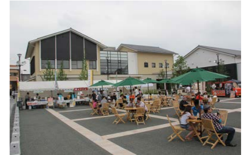
奥の細道むすびの地記念館（大垣市）