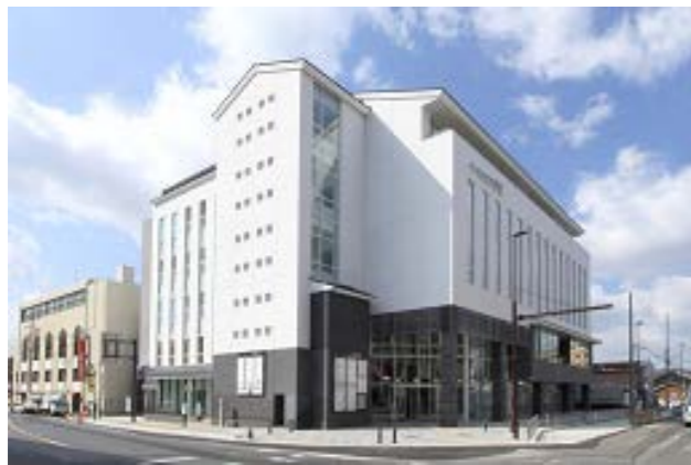
上野市駅前地区再開発事業（伊賀市）