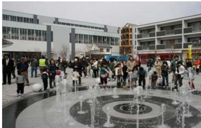
50m歩道整備事業（東海市）