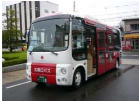
中心市街地バス事業（提案事業）（豊田市）