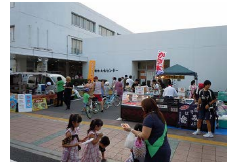
藤枝市文化センター（藤枝市）