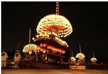
【津島市】尾張津島天王祭（宵祭）