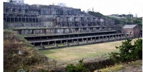
【佐渡金銀山遺跡（北沢浮遊選鉱場）】

国指定の重要文化財「旧佐渡鉱山採鉱施設」、国指定の史跡「佐渡金銀山遺跡」及びその周辺の鉱山町一帯と、善知鳥神社祭礼や鉱山祭とそこで披露される郷土芸能、無名異焼の製造・販売等からなる歴史的風致の維持向上を図るため、歴史的建造物の保存修理、公有化した旧深見家住宅等の歴史的建造物を活用した拠点施設整備、それら歴史的建造物を回遊するための道路の美装化等の事業や、相川音頭を踊るイベントの宵乃舞など、地域行事の運営にかかる支援を位置づけています。