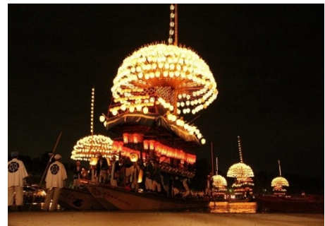
【尾張津島天王祭（宵祭）】

国指定の重要文化財「津島神社本殿・楼門」及びその周辺地域と、600年近く続く尾張津島天王祭、津島駅西地区の山車祭や石採祭及び茶の湯文化からなる歴史的風致の維持向上を図るため、津島駅西地区に所在する旧津島信用金庫本店等の歴史的建造物の保存・活用事業や、山車等が巡行する道路の美装化、地域の子供たちへの歴史・文化学習事業等を位置づけています。