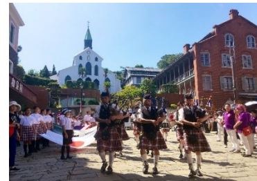
【長崎市】長崎居留地まつり

※なお、認定式については、新型コロナウイルス感染症の感染拡大防止のため、実施を当面の間、延期いたします。