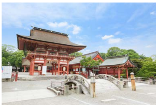
津島神社 (国指定重要文化財)

津島市は、古くから津島神社の「門前町」、尾張と伊勢を結ぶ要衝の「津島湊」として繁栄し、国指定重要文化財である津島神社や、ユネスコ無形文化遺産に登録された尾張津島天王祭をはじめ、現在でも多くの歴史的風情、情緒が残るまちです。