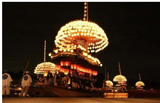
尾張津島天王祭 (ユネスコ無形文化遺産)