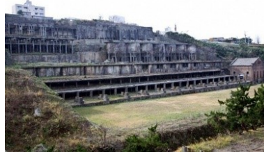
【佐渡市】佐渡金銀山遺跡（北沢浮遊選鉱場）