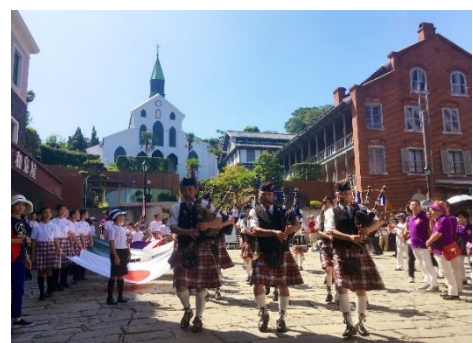
【長崎居留地まつり】

国宝「大浦天主堂」や国指定の重要文化財「旧グラバー住宅」、重要伝統的建造物群保存地区「長崎市東山手・南山手重要伝統的建造物群保存地区」及びその周辺地域と、歴史的建造物等の保存活動の一環として始まった長崎居留地まつりや大浦諏訪神社の大浦くんち等の歴史的風致の維持及び向上を図るため、旧グラバー住宅をはじめとする歴史的建造物の保存修理や、歴史的建造物のライトアップ、市民への歴史学習講座の開催等の事業を位置づけています。