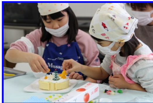
〈写真は2018年のものです〉