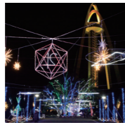
※2018年のイルミネーション

今年のイルミネーションのテーマは「THE BEAUTIFUL EARTH~未来をつくる、SDGs~」とし、ツインアーチ138館内と園内全域をイルミネーションで装飾し、国連で定められたSDGsで叶える「未来の地球の美しさ」を表現します。また、11/16(土)は主催者による点灯式を行います。