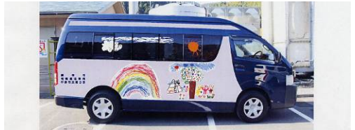
【自主運行バス・幼稚園児の協力やバザー寄付などでラッピング完成】

生き生きフォーラムが行ってきた取り組みが評価を受け、市において中山間地域の活性化計画の策定が住民参加で進められており、来年度より実施に移される運びとなった。