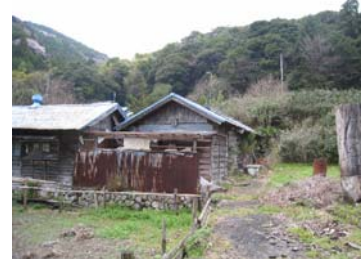
【空き家と放置農地の状況】