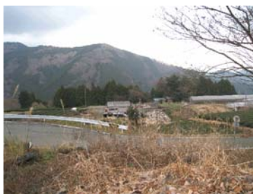
【土地所有者の不在化が進む中山間地域】