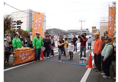
【駅前商店街での地域 PR】

定住促進の取り組みでは広報活動を通じた紹介で子供世帯のいない限界集落の空き家に若者夫婦が移り住んでくれたことがあげられる。