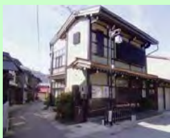
岐阜県 飛騨市 (古川地区)