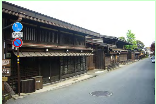
岐阜県 高山市 (高山市美しい景観と潤いのあるまちづくり条例)