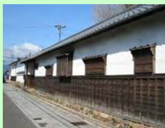
※10年以上の一般公開を行うもの 三重県 亀山市