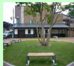
岐阜県 飛騨市 (神岡地区)