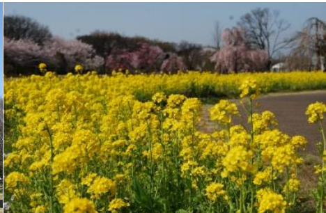
フラワーパーク江南 ハナナの花畑と桜