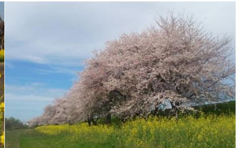
桜堤サブセンター 木曽長良背割堤の桜