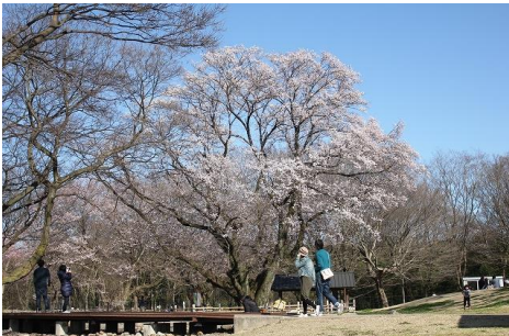
138タワーパーク 園内のエドヒガンザクラ

桜堤サブセンターでは「木曽長良背割堤」の、約2kmに渡る250本の桜と菜の花の開花に合わせて「背割堤さくらまつり」を開催します。「魚つり体験」や「手作り舟せせらぎレース」「円空彫り体験」などの親子で楽しめるイベントを開催する他、背割堤の桜や木曽川・長良川を上空約30mから眺める「熱気球体験会」も開催します。