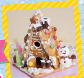
今年はお菓子の家を土台として使用します