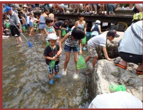
アユのつかみ取り

木曾川水園じゃぶじゃぶの河原での「アユのつかみ取り」や、「楽園のお月見」イベントの他、かさだ広場では大人気の「大玉で遊ぼう！」など園内各施設の特性を活かし、家族からカップル、子供から大人まで秋の行楽シーズンに楽しめる様々なイベントを開催いたします。ご多忙とは存じますが、ぜひご取材並びにご掲載のほどよろしくお願い申し上げます。