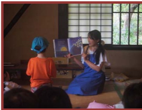
「楽園のお月見」月の絵本よみかせ