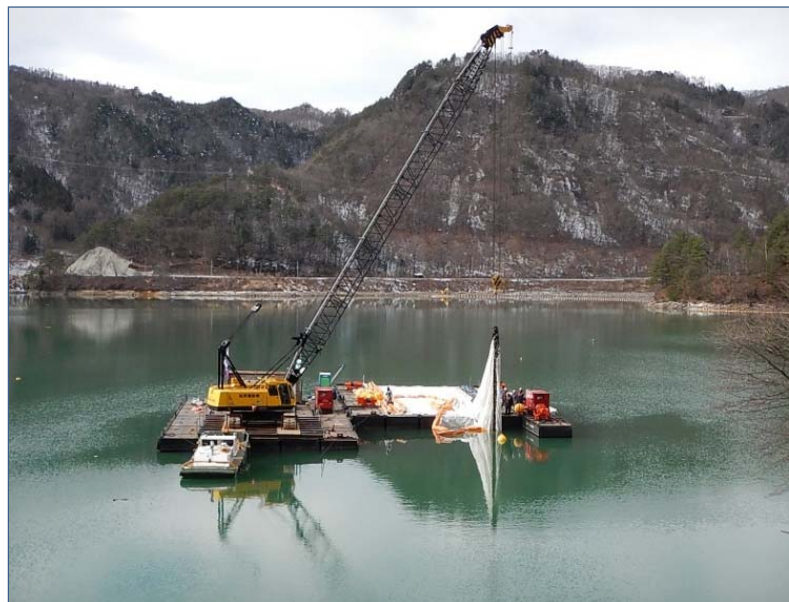
汚濁防止膜設置工事の状況