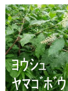
ヨウシュ ヤマゴボウ