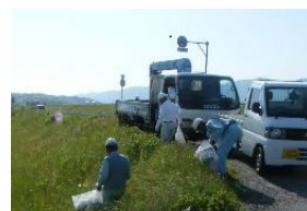
異物等の除去状況(例)