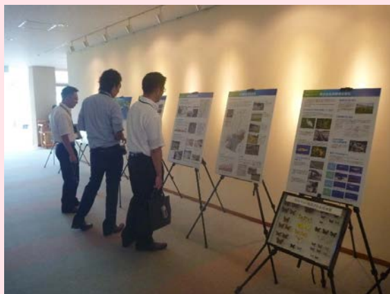
講演会場入口でのパネル展示