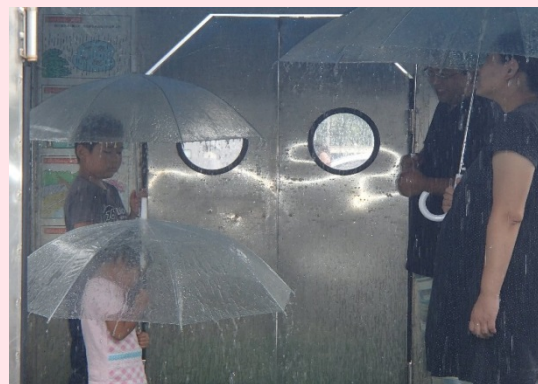
降雨体験車で時間雨量120mmの雨に当たり、「実際に何時間も降られたらと思うとゾッとす」と体験者