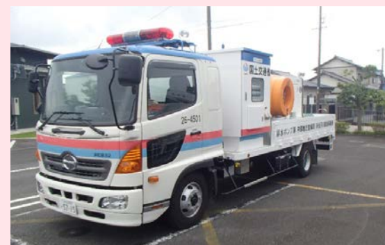
会場の外では、排水ポンプ車と照明車の展示が行われました