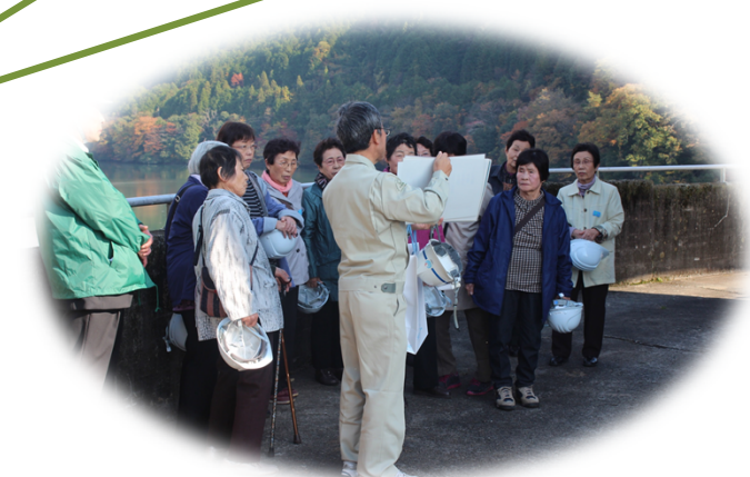
当時日本一の高さを誇った丸山ダム建設の話に興味津々