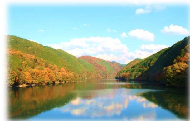
木々が色付き始めた丸山ダム貯水湖