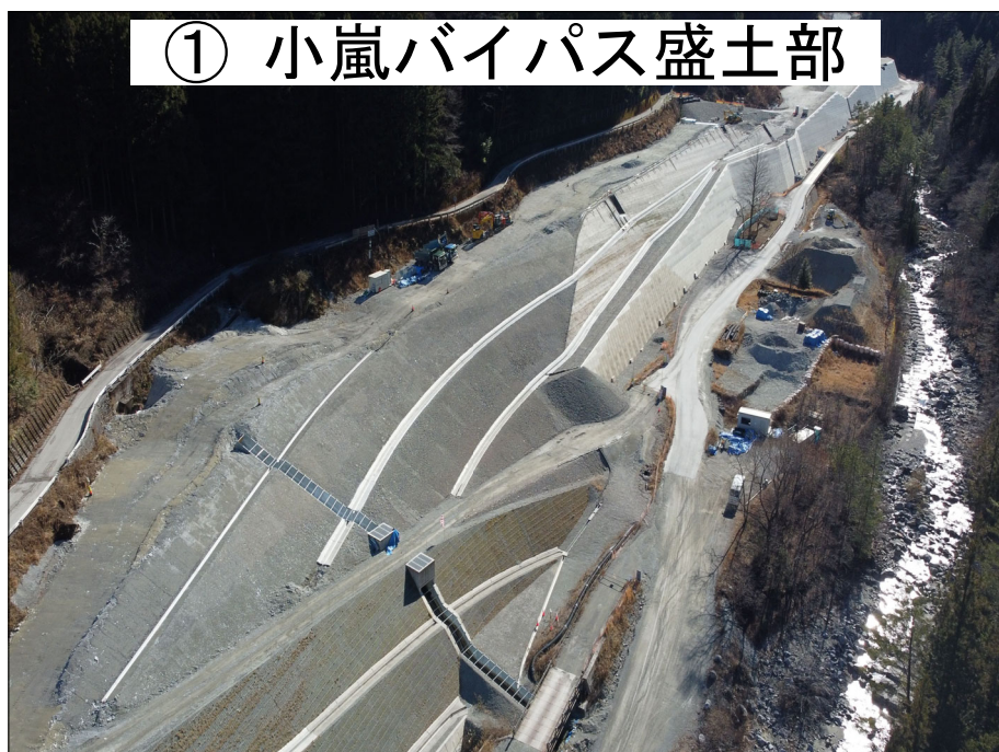
① 小嵐バイパス盛土部