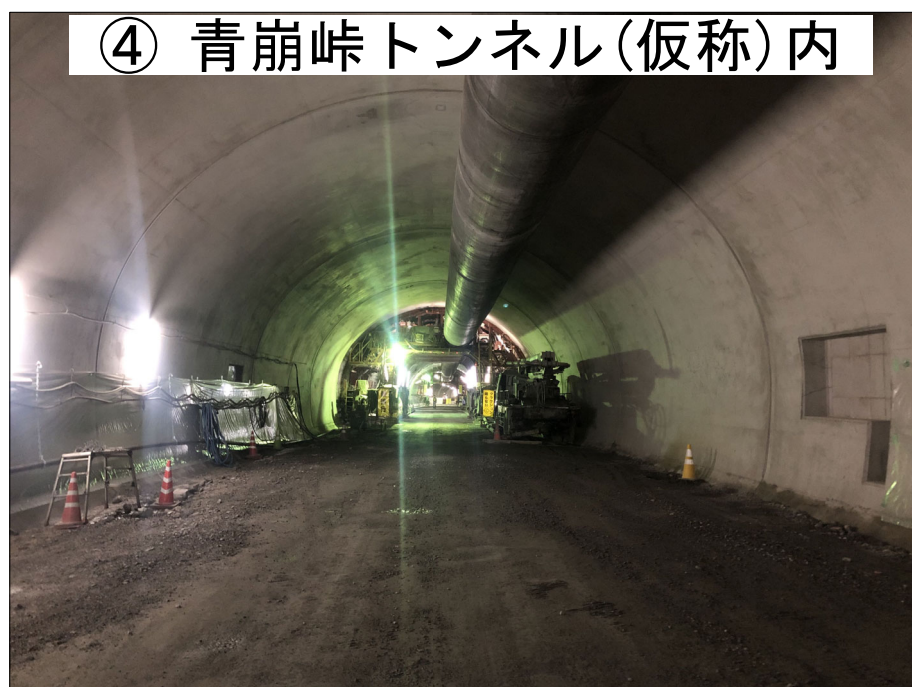
④ 青崩峠トンネル(仮称)内

H30年度三遠南信小嵐トンネル本坑工事 進捗率 59.6% H30年度三遠南信池島トンネル本坑工事 進捗率 69.1%