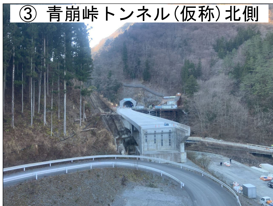
③ 青崩峠トンネル(仮称)北側