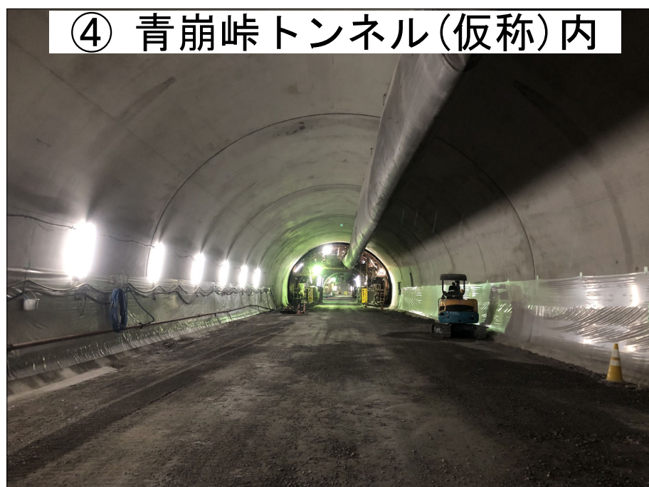
④ 青崩峠トンネル(仮称)内

H30年度三遠南信小嵐トンネル本坑工事 進捗率 57.6% H30年度三遠南信池島トンネル本坑工事 進捗率 56.7%