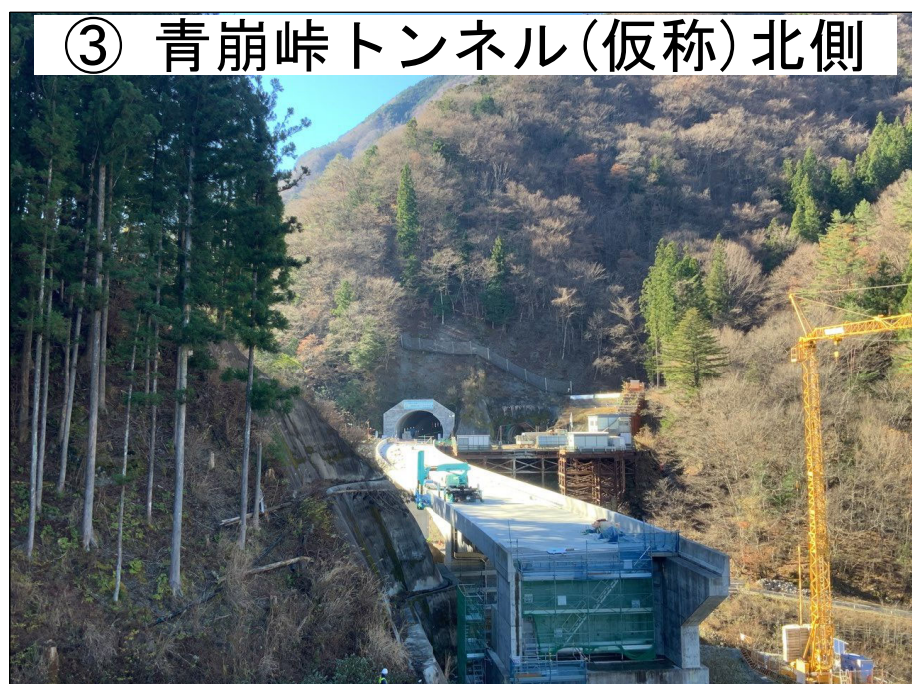
③ 青崩峠トンネル(仮称)北側