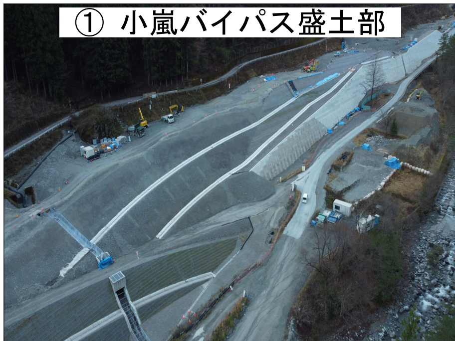
① 小嵐バイパス盛土部