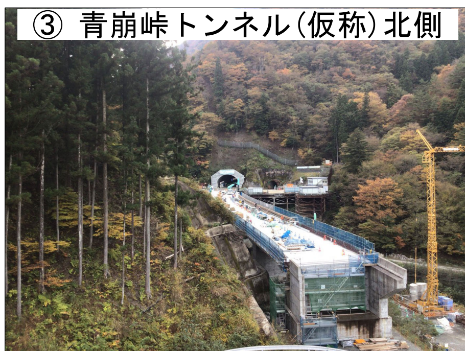
③ 青崩峠トンネル(仮称)北側