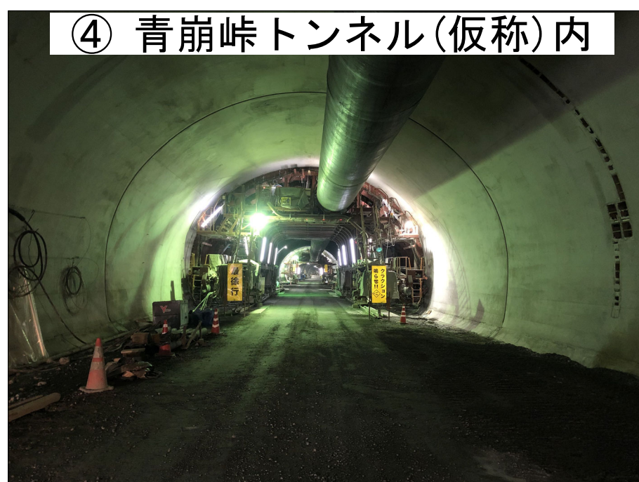
④ 青崩峠トンネル(仮称)内

H30年度三遠南信小嵐トンネル本坑工事 進捗率 55.5% H30年度三遠南信池島トンネル本坑工事 進捗率 56.7%