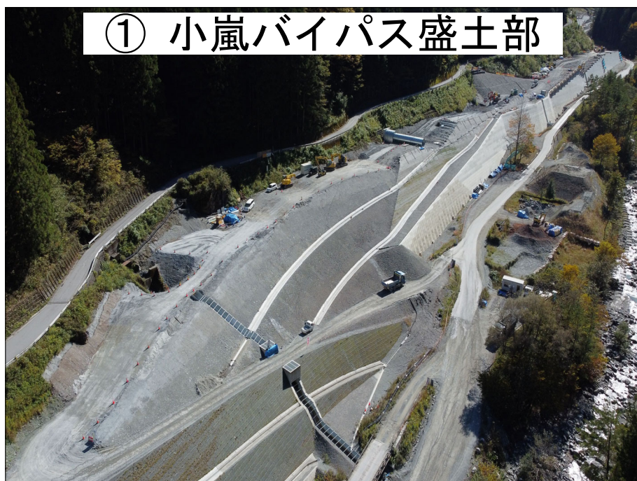
① 小嵐バイパス盛土部