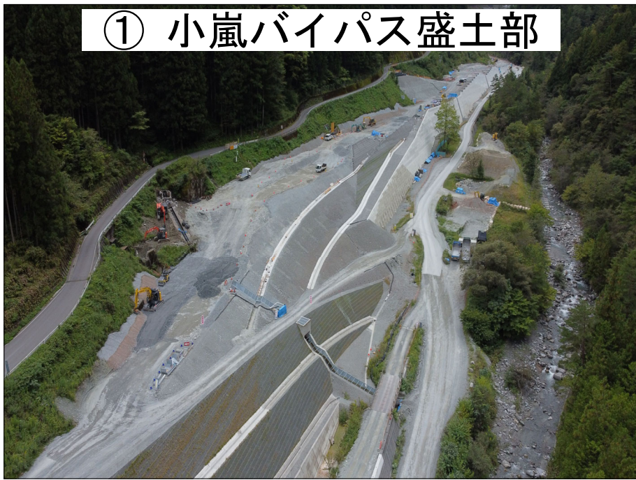
① 小嵐バイパス盛土部