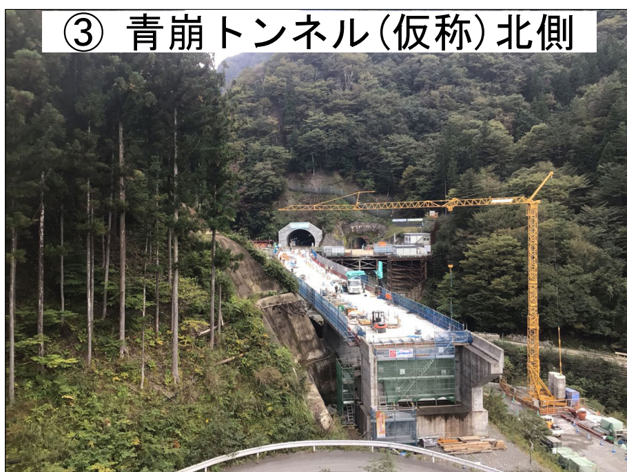
③ 青崩トンネル(仮称)北側