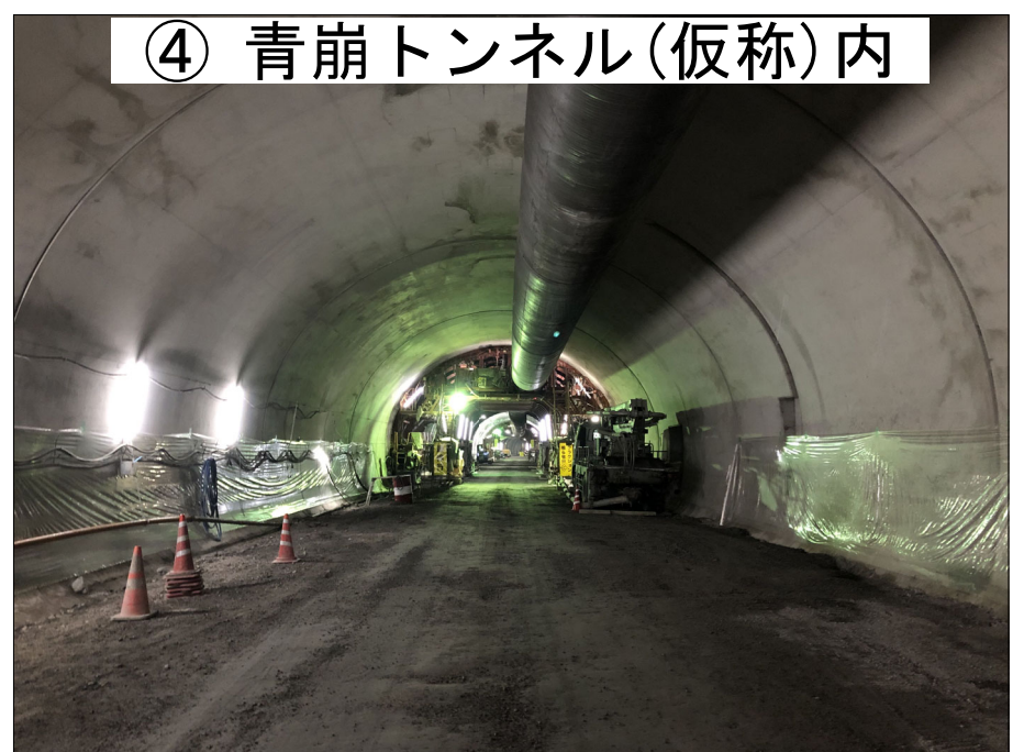
④ 青崩トンネル(仮称)内

H30年度三遠南信小嵐トンネル本坑工事 進捗率 53.2% H30年度三遠南信池島トンネル本坑工事 進捗率 53.0%