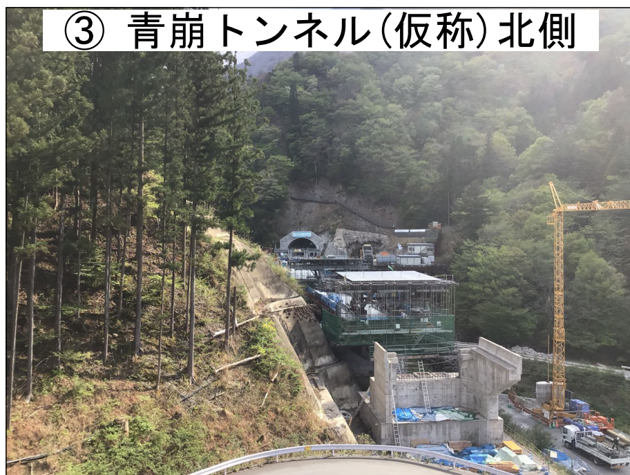
③ 青崩トンネル(仮称)北側