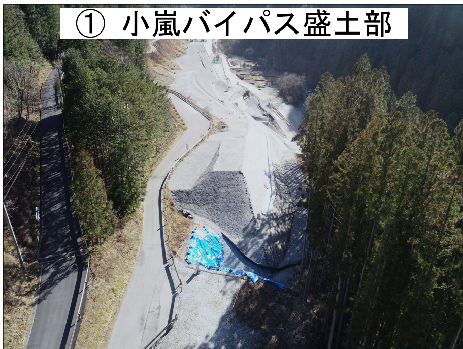
① 小嵐バイパス盛土部