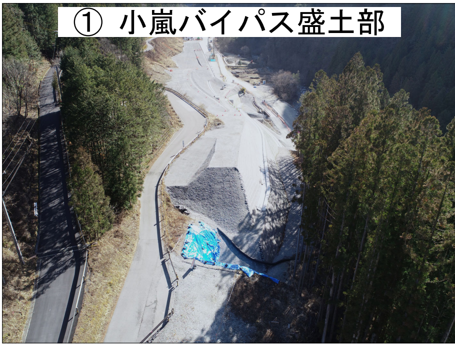
① 小嵐バイパス盛土部