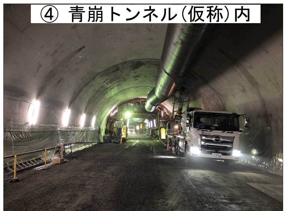
④ 青崩トンネル(仮称)内

H30年度三遠南信小嵐トンネル本坑工事 進捗率 39.9% H30年度三遠南信池島トンネル本坑工事 進捗率 37.5%