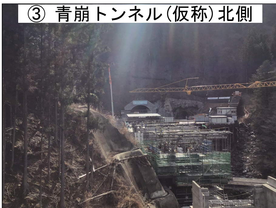
③ 青崩トンネル(仮称)北側