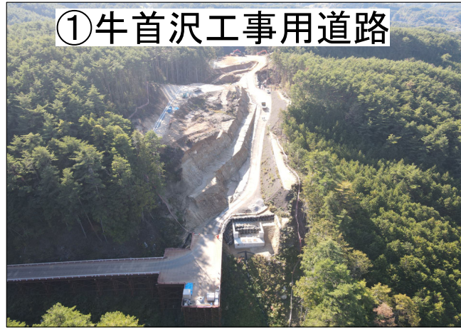
①牛首沢工事用道路