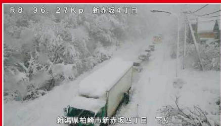
R8 96、27Kp 新赤坂4丁目