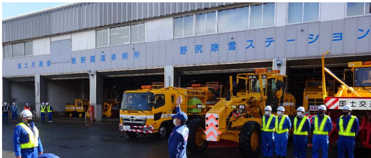
除雪出動式 (R4.11.14 野尻除雪ステーション)