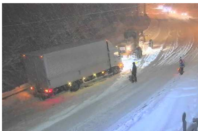
車両のスタック状況 (R3.12.17 国道18号飯綱町)