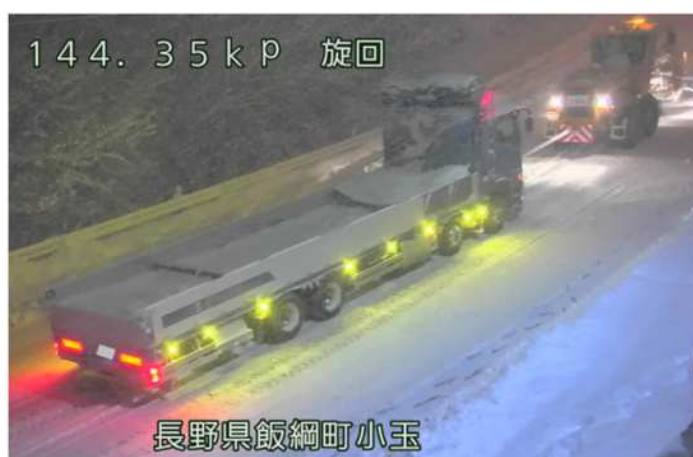
スタック車両の牽引状況 (R3.12.17 国道18号飯綱町)