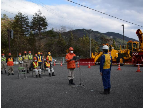
除雪作業の無事故を誓う「安全宣言」