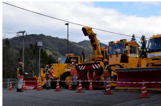
除雪機械の「安全確認」