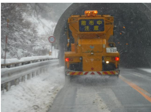
凍結防止剤の散布

冬期には、安全な通行路を確保するため道路に凍結防止剤をまいたり、日中に加え通勤時間帯前や夜間にも除雪作業を行っています。